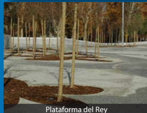
Plataforma del Rey