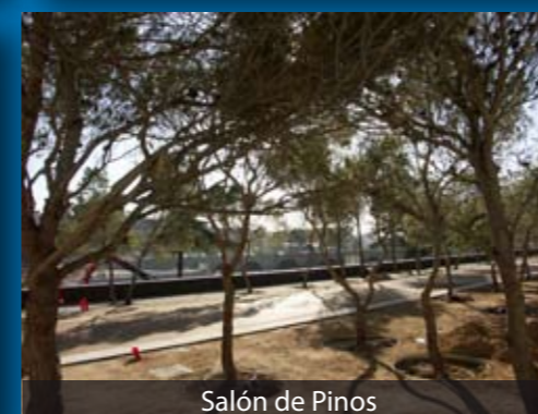
Salón de Pinos