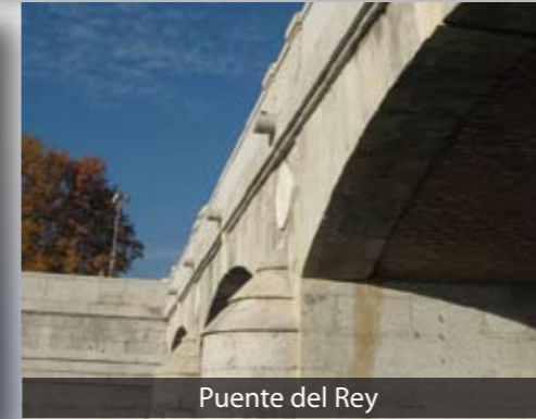
Puente del Rey