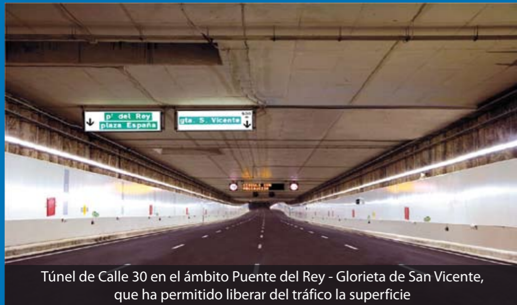
Túnel de Calle 30 en el ámbito Puente del Rey - Glorieta de San Vicente, que ha permitido liberar del tráfico la superficie