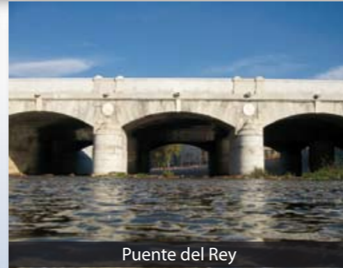
Puente del Rey