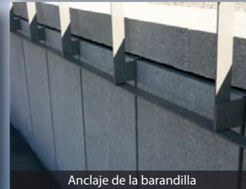
Anclaje de la barandilla