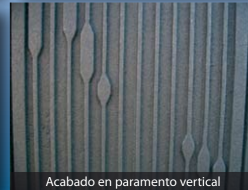
Acabado en paramento vertical