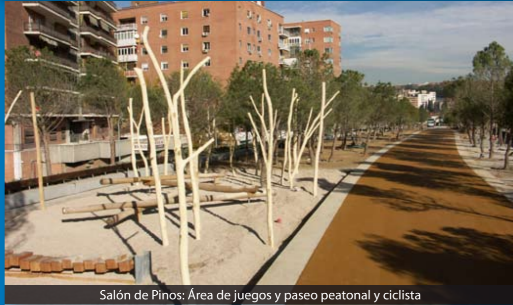
Salón de Pinos: Área de juegos y paseo peatonal y ciclista