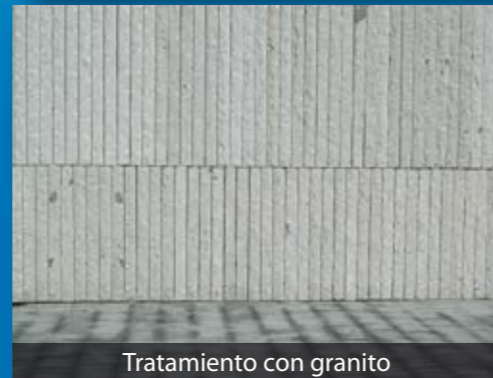
Tratamiento con granito