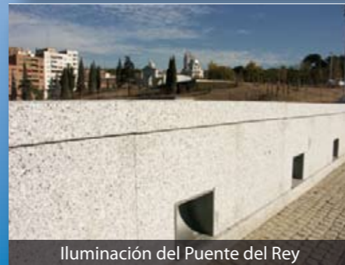
Iluminación del Puente del Rey